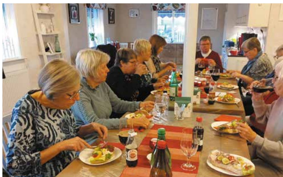
Bild från höstavslutningen.