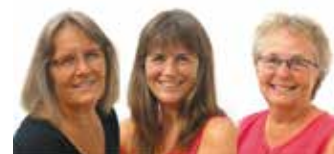
"Kanarieteamet" jobbar vanligtvis med Evangeliska Turistkyrkan på Gran Canaria.