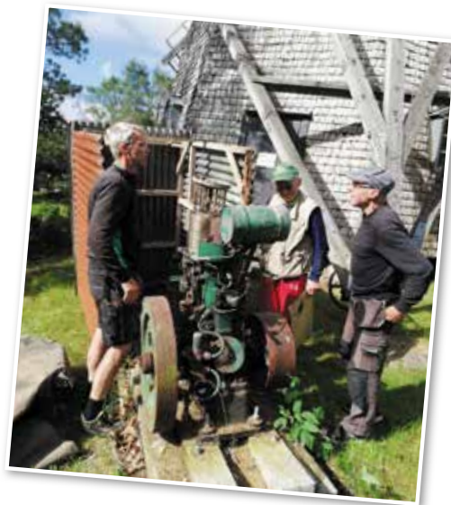
Besiktning av vår gamla tändkulemotor. Många "kloka gubbar" var på plats.