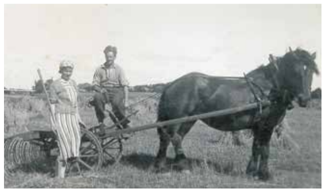
Mamma & Pappa.