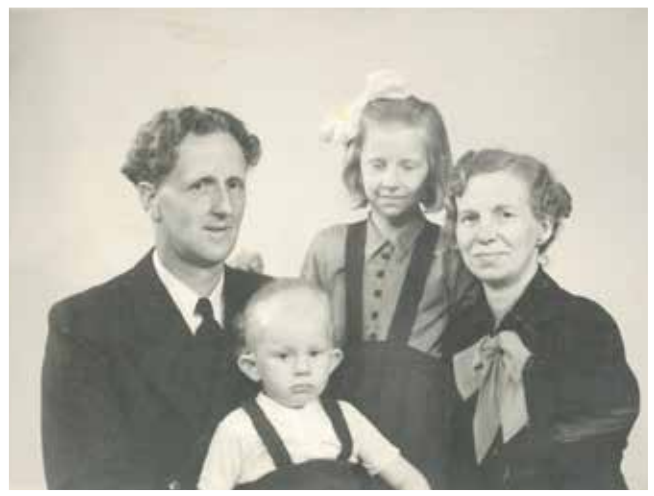
Mamma, Pappa, jag & Paula.