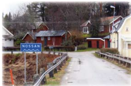
Nu finns Nossan-skylden uppsatt vid bron i Fåglum!