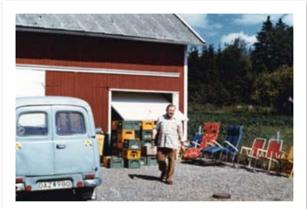
"Lexen" vid drickbacksförrådet och avdelningen för sommarmöbler. Och vem minns inte Volvo Duetten?