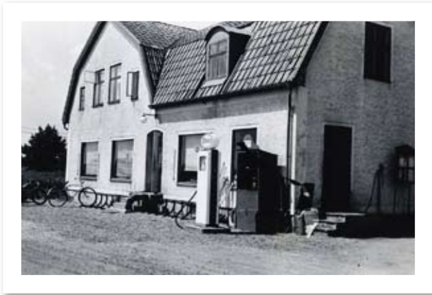
Alex Johanssons Eftr.